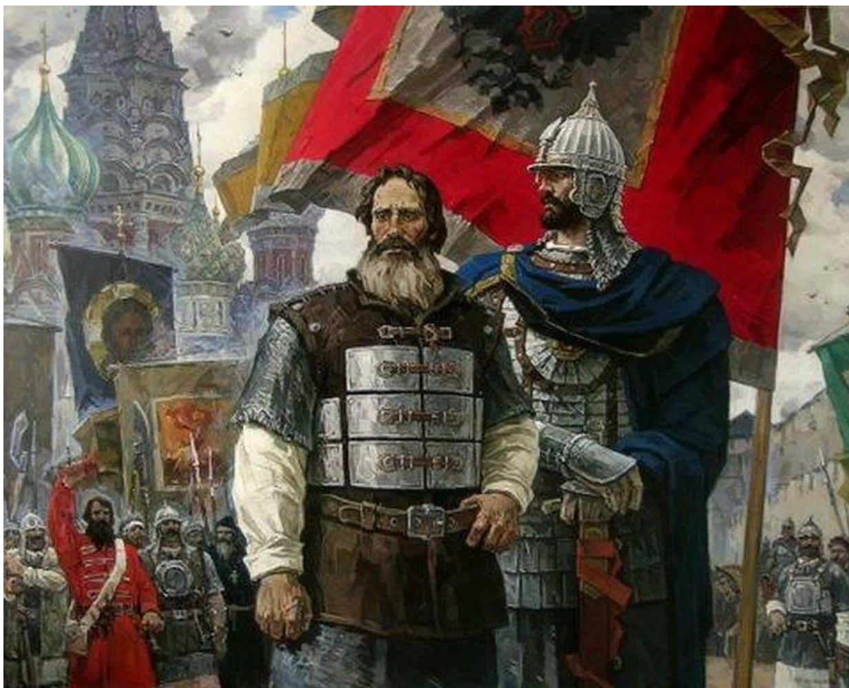
Кузьма Минин и Дмитрий Пожарский

Тогда была предпринята вторая попытка. В сентябре 1611 года в Нижнем Новгороде земский староста Кузьма Минин обратился к людям с призывом собрать средства и создать ополчение для освобождения страны. Население города было обложено особым сбором для организации ополчения. По предложению Минина на пост главного воеводы был приглашен новгородский князь Дмитрий Пожарский.